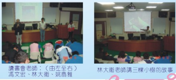
讀書會老師：(由左至右) 高文宏、林大衛、姚翕雅 林大衛老師講三棵小樹的故事